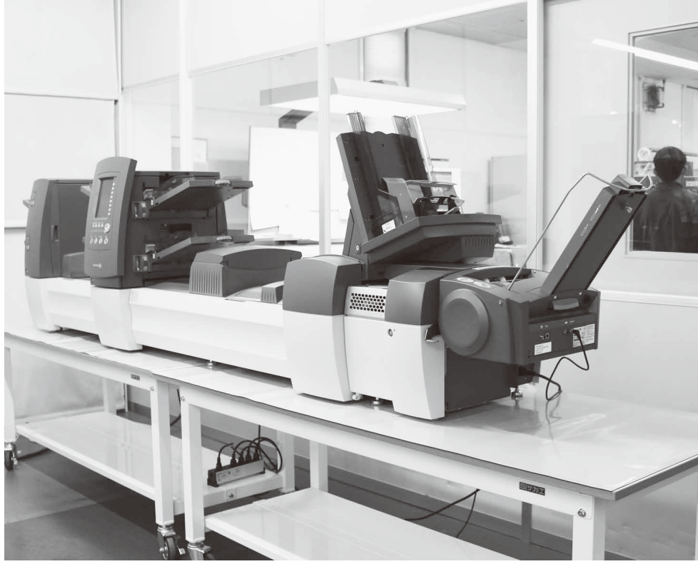
封入・封緘機「Relay 7000 inserting system」