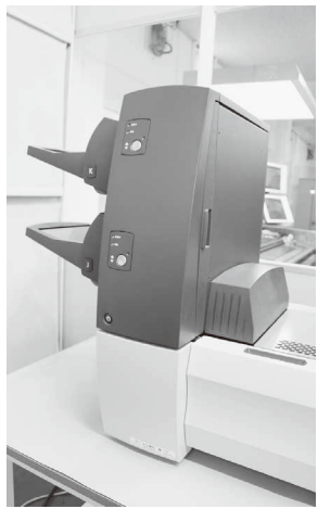
パリアブル封入が可能シートフィーダー

また、同社は高速ダイレクト宛印字機も同時に導入したため、宛名印字から封入・封緘、発送までの一貫生産体制を構築したことになる。有定社長は「2022年12月14日に東京・池袋で開催される」